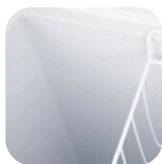
Interior de acero pre pintado